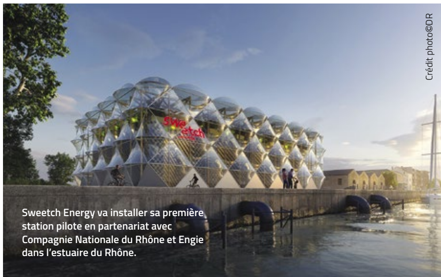
Sweetch Energy va installer sa première station pilote en partenariat avec Compagnie Nationale du Rhône et Engie dans l'estuaire du Rhône.

Via une nouvelle levée de fonds de 25 millions d'euros, Sweetch Energy va déployer sa technologie sur le terrain en partenariat avec Compagnie Nationale du Rhône. En cours de construction, le démonstrateur entrera en service en 2025. « Comme dans tous les grands fleuves, l'estuaire du Rhône dispose d'un immense potentiel d'électricité décarbonée. Notre station pilote, première étape du développement de l'énergie osmotique sur le Rhône, sera capable de produire jusqu'à 500 MW, soit les besoins de la population d'une grande ville comme Marseille et son agglomération. » D'autres projets sont en cours, notamment aux USA où l'entreprise va ouvrir très prochainement un bureau à Boston.