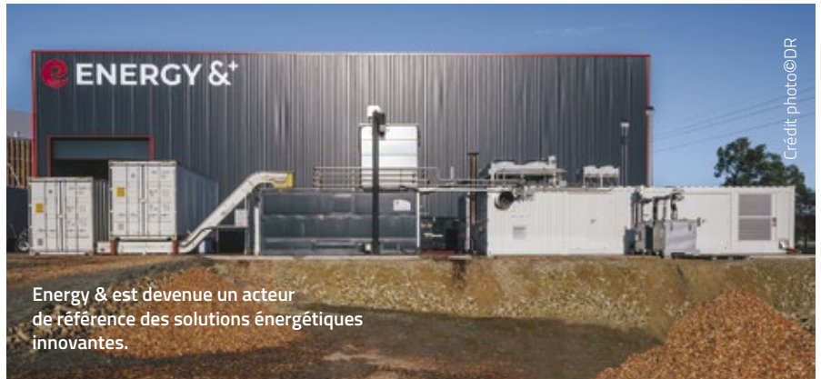
Energy & est devenue un acteur de référence des solutions énergétiques innovantes.

Cette réactivité fait le bonheur des clients, privés ou publics, de la société de Saint-Nolff. En 2010, Energy & +