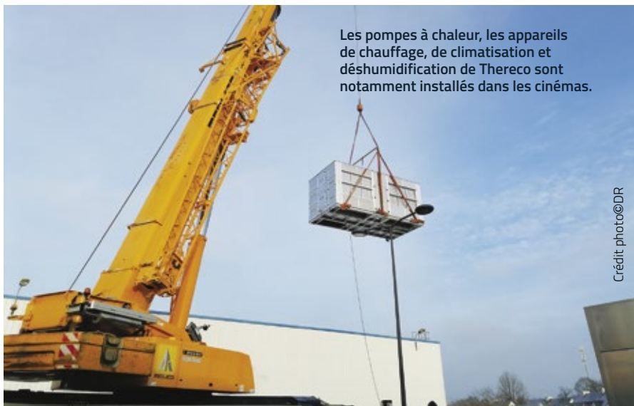
Les pompes à chaleur, les appareils de chauffage, de climatisation et déshumidification de Thereco sont notamment installés dans les cinémas.

« PRÈS DE 90% DE NOS ÉQUIPEMENTS SONT RECYCLABLES. »